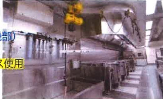
【活用事例】 ホテルの厨房