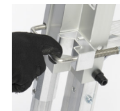
手すり ロックは 指1本で 操作可能