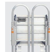
手すりを たたんで 収納可能