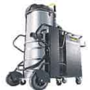
IVS 100/55 品番 : 1.573-723.0(50Hz) 1.573-724.0(60Hz)