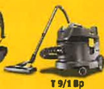
T 9/1 Bp