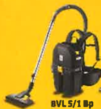
BVL 5/1 Bp