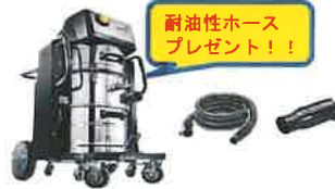
IVC 60/30 Tact 2 品番 : 1.576-111.0(50Hz) 1.576-112.0(60Hz)