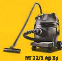
NT 22/1 Ap Bp