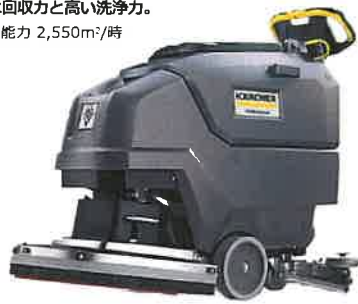
BD 50/55 W Classic Bp 3時間仕様 品番 : 3.137-164.0

ケルヒャー史上最高の 汚水回収力と高い洗浄力。 清掃能力 2,550m 2 /時