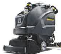
BR 55/40 W BP スタANDARD 品番 : 9.548-530.0