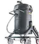
IVR-L 120/24-2 Tc 品番 : 9.989-491.0