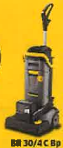
BR 30/4 C Bp