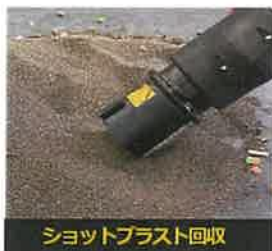
ショットブラスト回収