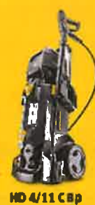
HD 4/11 C Bp