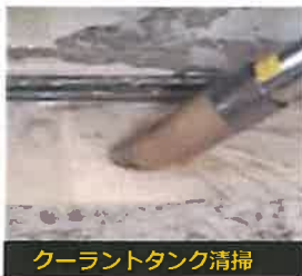
クーラントタンク清掃