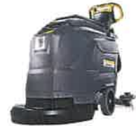
BD 43/25 C Bp 品番 : 9.548-547.0