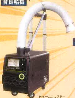
ヒュームコレクター