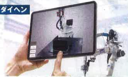
タブレットによる教示レスシステム PHOTOUCH TEACH