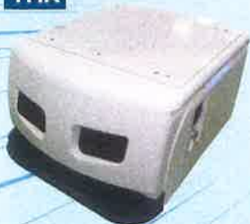
自律走行型ロボット SIGNAS