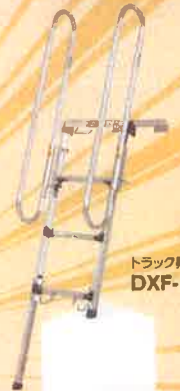
トラック昇降ステップ DXF-14TEA