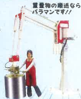
重量物の搬送なら バラマンです!!