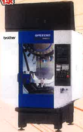
5軸マシニングセンタ U500Xd1