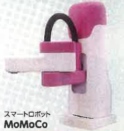
スマートロボット MoMoCo