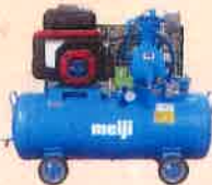
バッテリーコンプレッサ GEPK-15