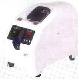
オートリベットフィーダー ARF810E